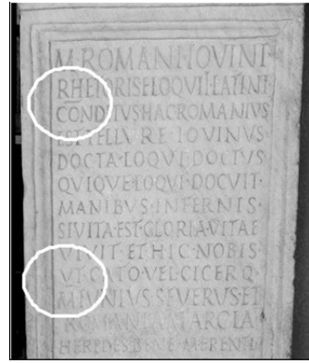
Fig. 3: CIL VI 33904 with praescriptum and subscriptum in prose.

The signs of punctuation, like this virgula separating different parts of the text, have been neglected and therefore often ignored. This is the main reason for the confusion of this virgula with the letter I, and clearly the starting point of this misreading held for quite a long time. It is reasonable that the first editors opted for the lectio facilior , and that they did not hesitate in reading (or reconstructing) the word iter , which, in addition, was perfectly appropriate in the context of the inscription. This case must be taken as a clear example of the importance of bearing in mind the ordinatio when editing Latin verse inscriptions.