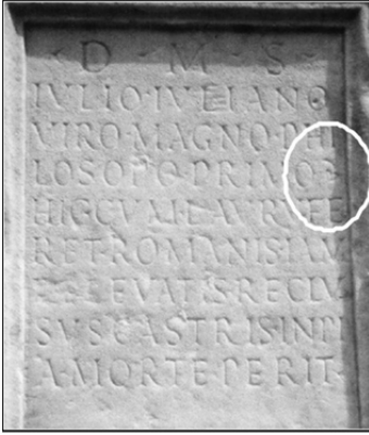
Fig. 2: CIL VI 9783.

Massaro's paper 31 . The custom of marking the bound between prose and verse by a graphic sign is well-documented in Latin verse inscriptions, whether the prose precedes or follows the verse (see figs. 2–3). Graphic signs are especially used when there is no difference between the lettering size of the text in prose and of the text in verse 32 , as in the case of CIL VI 5953. Thus, the reader should be able to distinguish both parts almost without difficulty. Although the use of a virgula in this use is a unique case within the carmina of Rome 33 , we have documented other signs with the same function in inscriptions from both Rome and Spain 34 .